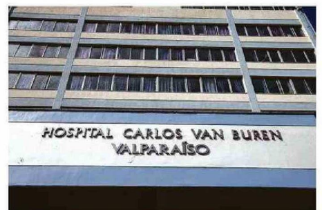
INDICACIÓN MÉDICA HABÍA SIDO CURSADA EL 20 DE DICIEMBRE.