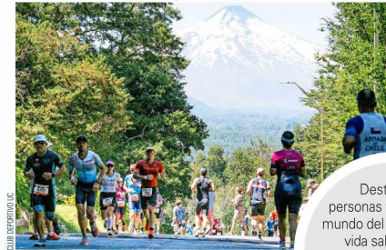
Este fue el primer Ironman de Pucón carbono neutral, gracias a la alianza estratégica con Colbún.

Destacadas personas vinculadas al mundo del deporte y a la vida saludable se sumaron a la campaña "Ironman 70.3 Pucón 2025, carbono neutral by Colbún".