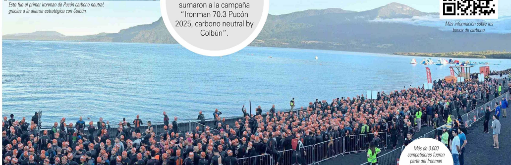
Más de 3.000 competidores fueron parte del Ironman 70.3 Pucón.