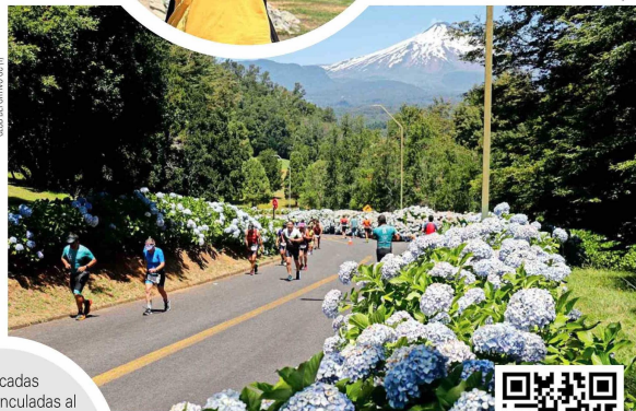
Colbún espera neutralizar alrededor de 500 toneladas de dióxido de carbono.

Destacadas personas vinculadas al mundo del deporte y a la vida saludable se sumaron a la campaña "Ironman 70.3 Pucón 2025, carbono neutral by Colbún".