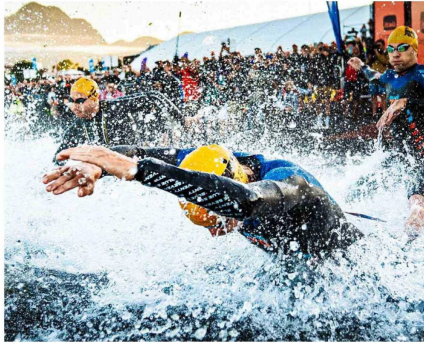
Colbún neutralizará el evento con bonos de carbono provenientes de su central hidroeléctrica Quileco.