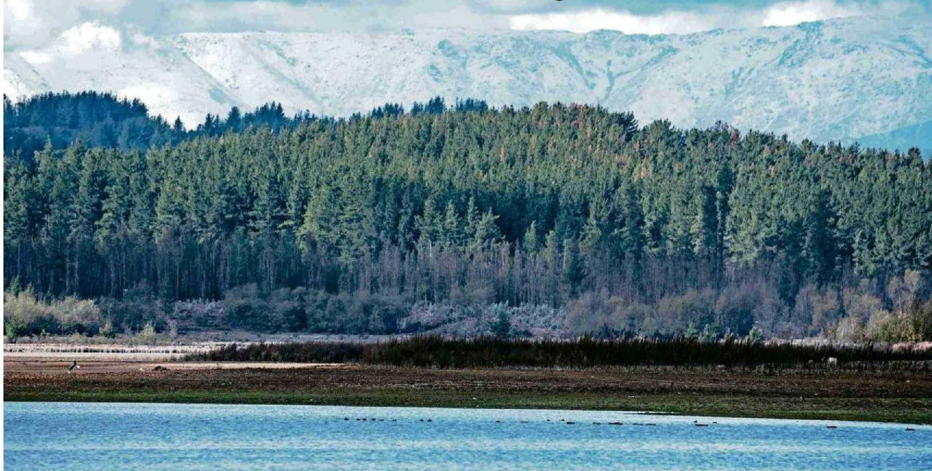
EN LAS ÚLTIMAS DÉCADAS EXTENSAS ÁREAS DE LAS REGIONES DEL BIOBÍO Y ÑUBLE HAN SIDO UTILIZADAS EN LA PLANTACIÓN DE ESPECIES DESTINADAS AL DESARROLLO DE LA INDUSTRIA FORESTAL CHILENA.

PROYECCIONES. Avanzar hacia la bioeconomía con uso de energías verdes y la construcción sustentable forman parte de las propuestas para ambas regiones en esta área. Gremios y expertos valoran el potencial de este sector como clave para el desarrollo.