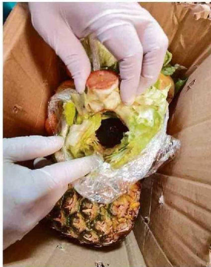
EN LECHUGAS, CHORITOS Y HASTA CARNE OCULTABAN LA DROGA.