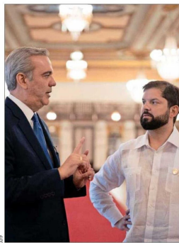
Los presidentes de República Dominicana, Luis Abinader, y de Chile, Gabriel Boric, conversan en Santo Domingo.

La actriz y activista ambiental reaparece con serie de TV que aborda la lucha contra el cambio climático: "Hay un mensaje del que quiero ser parte". | C 12