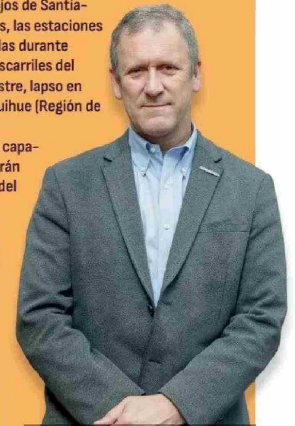
Juan Carlos Muñoz, ministro de Transportes y Telecomunicaciones.

3. Quinta generación y conectividad. Dentro del objetivo de “empujar por más presencia y más competencia en el sector”, el MTT indica que en 2025 comenzará “el despliegue de infraestructura 5G del cuarto actor adjudicatario de la nueva licitación efectuada por nuestra administración”, en referencia al proceso pendiente de WOM. Por otro lado, la cartera destacó que durante el primer trimestre “quedará firmado el contrato entre Google y la empresa pública Desarrollo País para así comenzar la obra y despliegue del cable submarino que conectará nuestro país con Oceanía”.