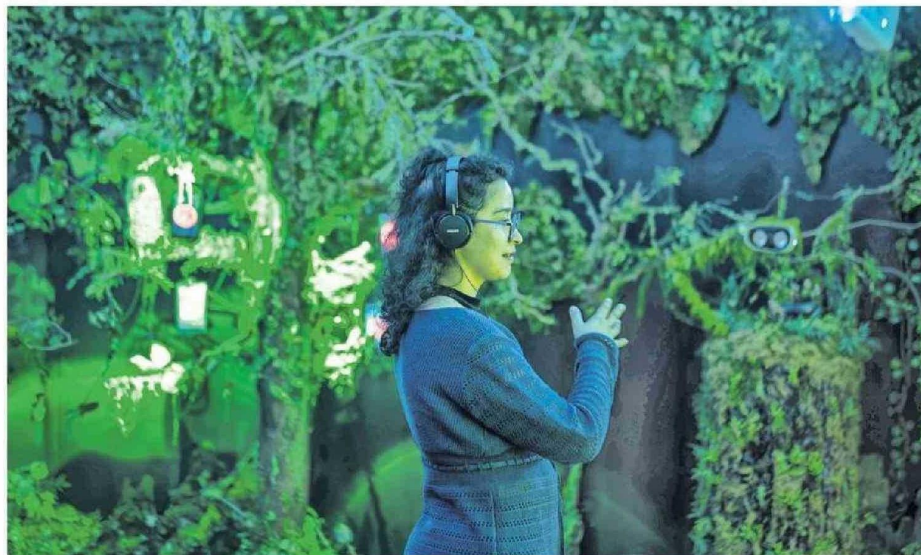
La exposición permite una experiencia inmersiva a los asistentes, ahondando así en los bosques y el daño de los incendios.

parte de una historia llamada 'El secreto del agua', señaló.