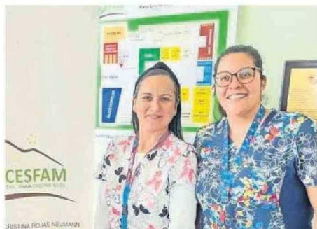
PARTE DEL EQUIPO DEL ECICEP EN EL CESFAM MARÍA CRISTINA ROJAS.

Con esta nueva modalidad, se quiere lograr que las personas tengan participación en su proceso de mejoría o de estabilización. "Busca realizar atenciones integrales según el riesgo que tenga cada una de las personas que se atienden en los establecimientos de atención primaria. Este nivel de riesgo va directamente relacionado con el número de patologías o condiciones crónicas que tienen cada una de las perso-