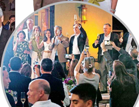
Con un brindis se dio inicio a la celebración de los 200 años de la Viña La Rosa.