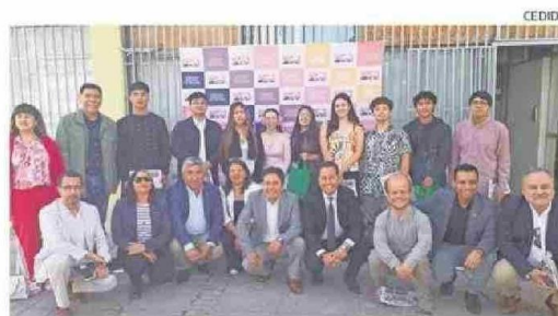
LAS AUTORIDADES FELICITARON LA DEDICACIÓN DE LOS ESTUDIANTES.

De todas maneras, desde el Demre se entregará un informe de resultados a cada establecimiento educacional, el cual presenta una síntesis de los antecedentes de selección y resultados agregados del grupo de estudiantes de cada unidad educativa que participó en el Proceso de Admisión a la Educación Superior 2024, el cual estará disponible a través del Portal Colegios del sitio web. CS