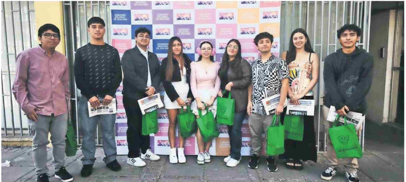
NUEVE FUERON LOS INVITADOS AL DESAYUNO CON LAS AUTORIDADES REGIONALES, AUNQUE SEGÚN DATOS DEL MINISTERIO DE EDUCACIÓN LAS DISTINCIONES POR TRAYECTORIA FUERON DADAS A 17 ESTUDIANTES EN ATACAMA.