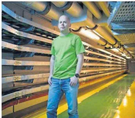
STEFFEN MIESKE ES ASTRÓNOMO Y FÍSICO.

Con una primera inversión de 1.500 millones de euros, proveniente del porcentaje del PIB que los 16 países miembros de la ESO aportan a la organización, esta revolucionaria instalación contará con un espejo principal de 39 metros compuesto por 798 segmentos hexagonales inintercambiables que conseguirán captar 20 veces más luz que cualquiera de los espejos del Very