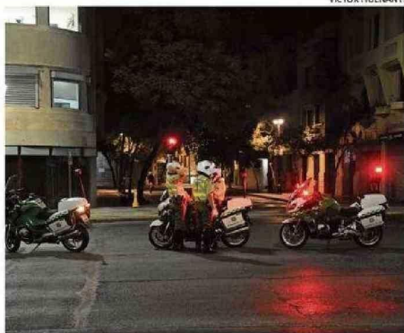
AYER SE LEVANTÓ EL TOQUE DE QUEDA PARA LAS 14 REGIONES.

nos de los activos de generación que no funcionaron o tuvieron fallas.