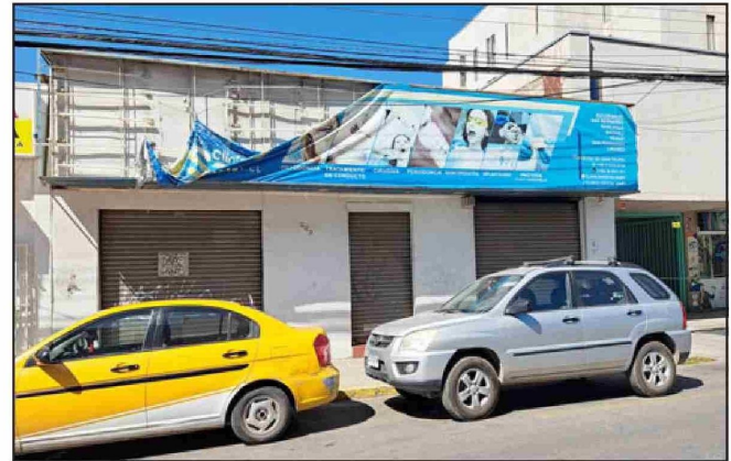
Así luce actualmente la Clínica Dental Samy. Los números de contacto en el cartel no corresponden a la empresa; el celular no responde y el teléfono fijo es de un centro de radiografías.