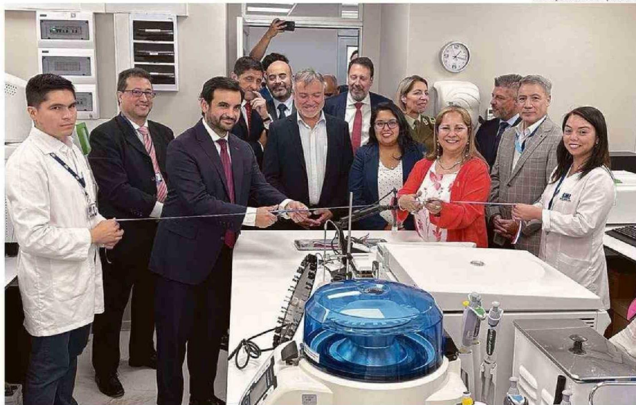
INVERSIÓN FUE FINANCIADA CON FONDOS SECTORIALES DEL MINISTERIO DE JUSTICIA. JEFE DE CARTERA INAUGURÓ LOS ESPACIOS.

“Estamos trabajando con el Servicio Médico Legal en un plan para disminuir las brechas periciales, así que es una muy buena noticia contar con un nuevo laboratorio para la región. Lo que se realiza acá es muy significativo para que nuestra justicia cumpla con algo fundamental para la ciudadanía, y es que ésta sea oportuna, veraz, objetiva, y