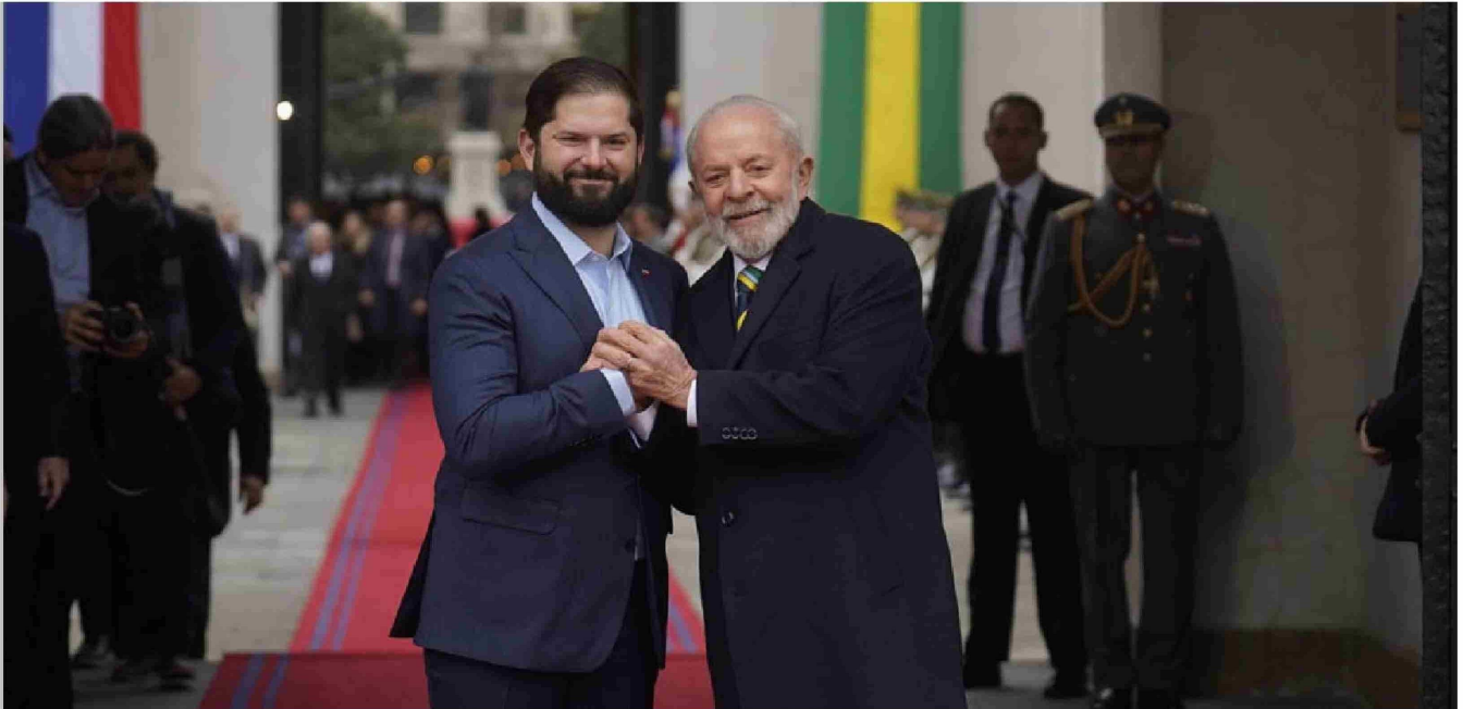
► El Presidente de Chile, Gabriel Boric, y su par de Brasil, Luiz Inácio Lula da Silva.