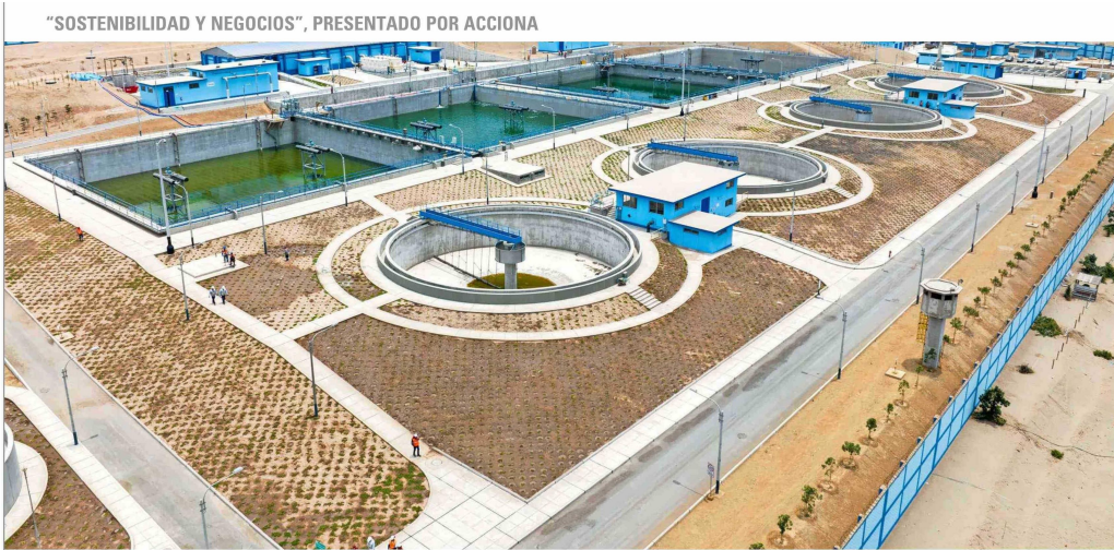
“SOSTENIBILIDAD Y NEGOCIOS”, PRESENTADO POR ACCIONA