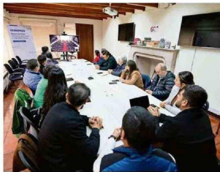
FABINETE DE LA REGIÓN PRESENCIÓ CUENTA PÚBLICA EN SENAPRED.

peta, Punilla, Zapallar y Chillán. Si el delegado valoró esos anuncios, debería poner fecha tanto de la licitación y construcción del Punilla. Yo no tengo ninguna confianza en que el Embalse La Punilla lo vayan a sacar en este Gobierno, y el Embalse Zapallar tampoco".