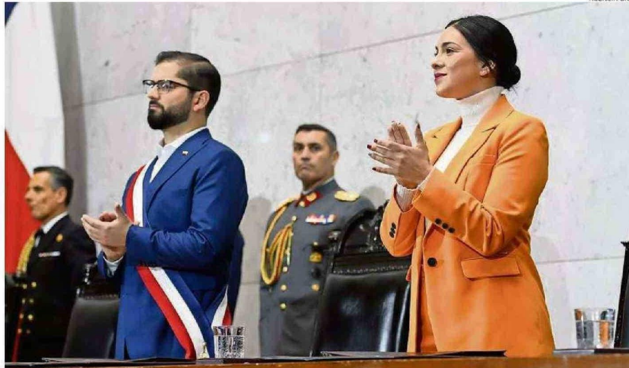
DISCURSO DEL MANDATARIO, A JUICIO DE DIRIGENTES LOCALES, ESTUVO DESPROVISTO DE ANUNCIOS PARA LAS ÁREAS PRODUCTIVAS DE ÑUBLE.