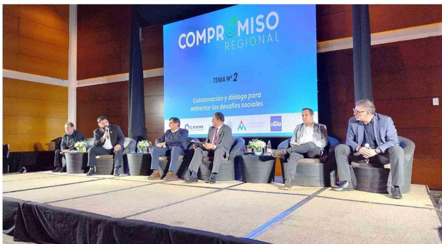
Esta nueva versión de Compromiso Regional contó con la asistencia de distintos gremios y autoridades, quienes analizaron los desafíos que afronta la región.

La nueva versión del ciclo Compromiso Regional contó con la destacada presencia del sociólogo Eugenio Tironi, quien dictó una charla en torno a la colaboración necesaria para abordar las demandas de la gente. Se espera que en noviembre se realice un nuevo encuentro, esta vez, enfocado en materia de seguridad.