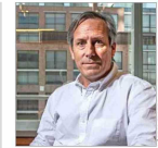
El exsubsecretario de ODP insiste en sus cuestionamientos.

HOY SE REVISARÁ RECURSO CLAVE PARA DEFINIR LA PERMANENCIA DEL DIRECTOR DE CARABINEROS | C1 y C2