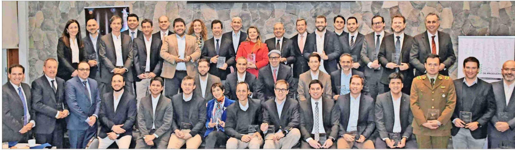
De más de 20 diversos sectores son las organizaciones premiadas.