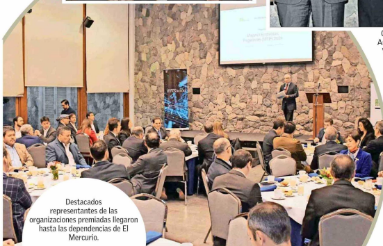
Destacados representantes de las organizaciones premiadas llegaron hasta las dependencias de El Mercurio.