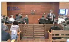
El grupo es indagado por estafa, soborno y figuras penales de la Ley de Mercado de Valores, entre otros.

Cuatro alumnos del INBA siguen hospitalizados, a casi tres meses de la explosión por elaboración de molotovs | C 7