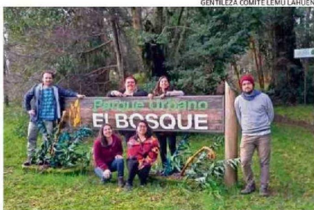
EL COMITÉ ECOLÓGICO TIENE UNA DIRECTIVA Y 80 SOCIOS.