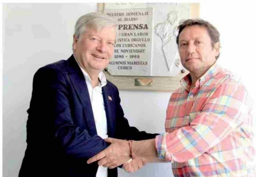
En la oportunidad, reiteró su apoyo a la candidatura de Pedro Pablo Álvarez-Salamanca como gobernador regional.

BUSCAMOS A LAS Y LOS MEJORES PARA SERVIR A CHILE