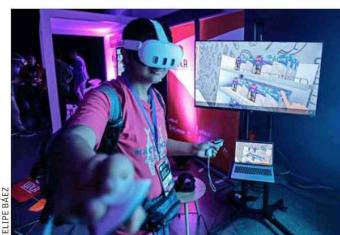
La UDLA exhibió una aplicación de realidad virtual que ayuda a personas de la tercera edad con deterioro cognitivo. Todos los asistentes la pueden probar.