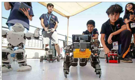
El equipo de robótica Fénix mostró varios robots con los que compiten en Chile y en el extranjero. Hace poco viajaron a Japón representando al país.