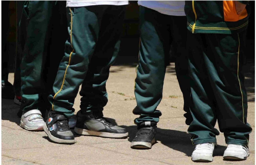
► En la Región Metropolitana se han concentrado 82 homicidios de menores entre 2022 y noviembre de 2024.

do para prevenir y frenar esta tendencia".