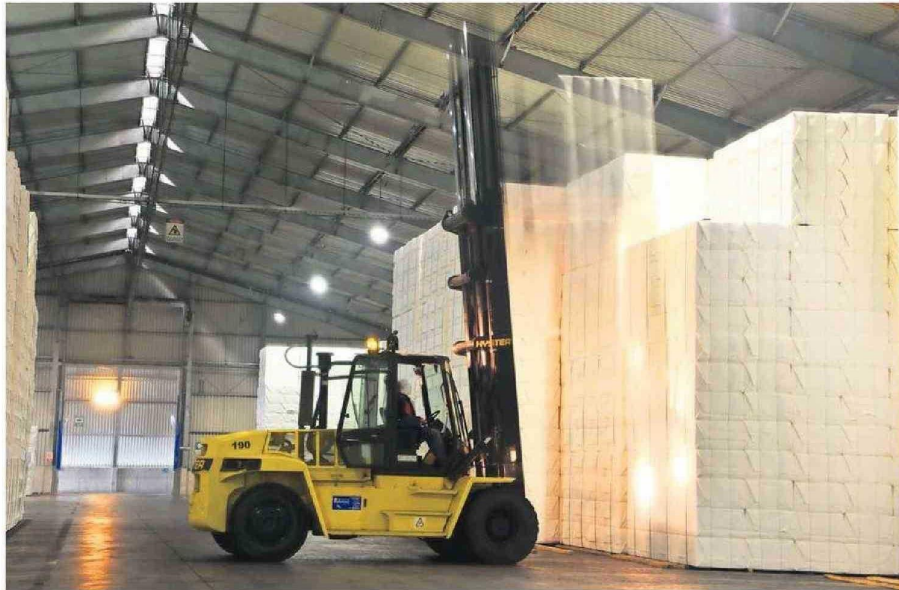
Un total de 36 mil empleos y más de 200 aserraderos se han perdido a nivel nacional debido a la crisis que afecta al rubro.

Desde Corma también postulan la necesidad de disminuir el costo de los seguros para pequeños y medianos propietarios forestales, alcanzar un 35% de las construcciones con estructura de madera al 2050 y una propuesta de exención de impues-