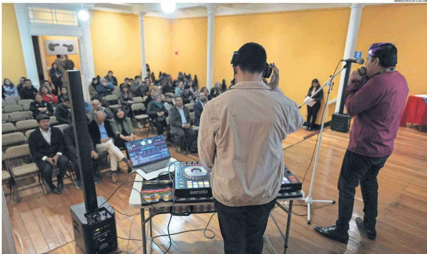
A LO LARGO DEL PAÍS Y DE LA REGIÓN EXISTEN DISTINTOS DESTINATARIOS PARA LOS FONDOS.

En conjunto financiarán 613 proyectos culturales de todas las regiones de Chile con más de $9.700 millones.