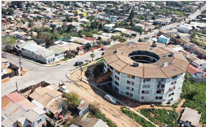
ESTRATÉGICO. — El edificio permite tener un control visual del entorno y de las principales vías de acceso al sector. Muros internos fueron derribados para conectar internamente departamentos y facilitar ocultar droga.

Advierten que hay una cultura de homenaje a la violencia,