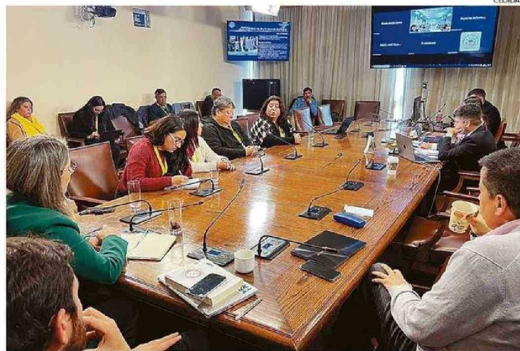
EN LA JORNADA DOBLE DE AYER ESTUVIERON PRESENTE CERCA DE UNA VEINTENA DE AFECTADOS.

Precisamente mientras recorría el sector, este acongojado padre aseguró que “no vi autoridades, no vi absolutamente a nadie salvo a unos bomberos que estaban en una bomba en calle