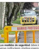
Las medidas de seguridad deben involucrar un esfuerzo mancomunado entre diversas instituciones, plantean especialistas.

Añade que "luego la estrategia debe considerar incentivos económicos para las familias y municipios para la reinserción escolar de jóvenes desahuciados, instalación de 'oficinas de oportunidades laborales' de cooperación público-privada para dar trabajos lícitos a jóvenes y adultos".