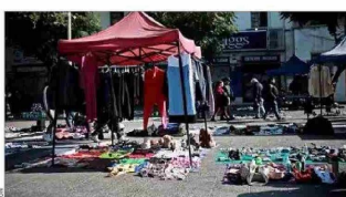
DERRUIDOS.— Sectores de la capital como Meiggs o la Vega Central se han deteriorado de la mano de la actividad informal.

Con distintos tipos de medidas, que van desde equipos de fiscalización hasta el aumento de permisos municipales, algunas autoridades han buscado enfrentar el fenómeno del comercio ambulante, que prolifera en barrios comerciales de las distintas ciudades.