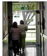
Actualmente, hay 2,5 millones de prestaciones atrasadas.

Otra propuesta, indica Sánchez, es "flexibilizar en forma inteligente la gestión médica para incentivar el trabajo fuera de horarios normales, sujeto a normas e incentivos claros y bien gestionados y supervisados para evitar el abuso", y "resgatar más recursos a establecimientos que claramente lo requieren, pero amarrados a cumplimiento de indicadores y metas, sancionando el incumplimiento".