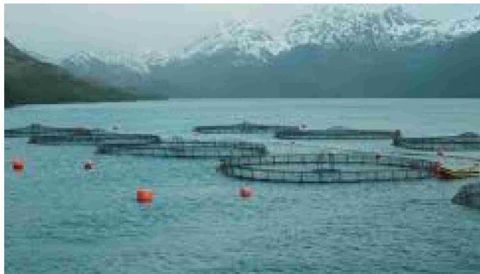
La industria acuícola es la principal actividad exportadora de la Región de Magallanes.