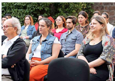
Titulados de la Universidad Mayor, quienes han participado en reuniones periódicas, interdisciplinarias e intergeneracionales de la casa de estudios con el fin de fomentar el intercambio de experiencias.