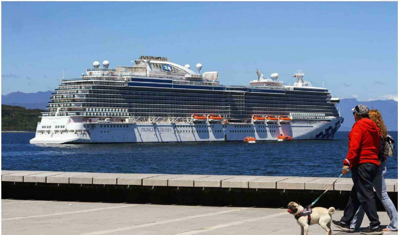
EL CRUCERO LLEGÓ AYER EN LA MAÑANA A LA CAPITAL REGIONAL.