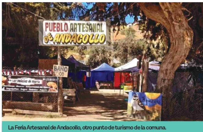
La Feria Artesanal de Andacollo, otro punto de turismo de la comuna.

crecer y trabajar con empresas, “porque solo le vendíamos a los vecinos, pero queremos ir más allá y ofrecer los productos a las empresas, crearles jardines o arreglárselos”.