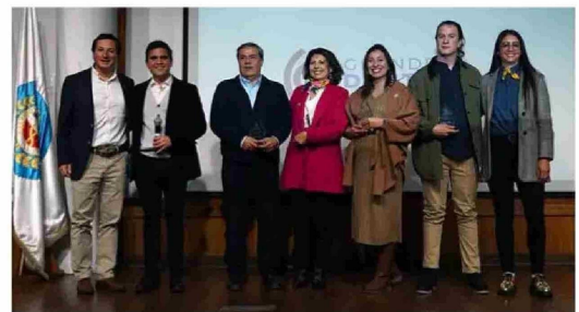
"Grandes Dentistas" es un premio que destaca a odontólogos en ámbitos como Docencia, Trayectoria, Talento Joven y Trabajo Social.

galardón es que la postulación es abierta, permitiendo a toda la comunidad nominara sus candidatos, quienes posteriormente son evaluados por un jurado compuesto por especialistas, expertos académicos y autoridades.