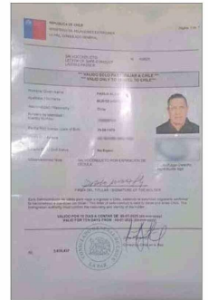
El salvoconducto que obtuvo en el consulado de Chile en La Paz.