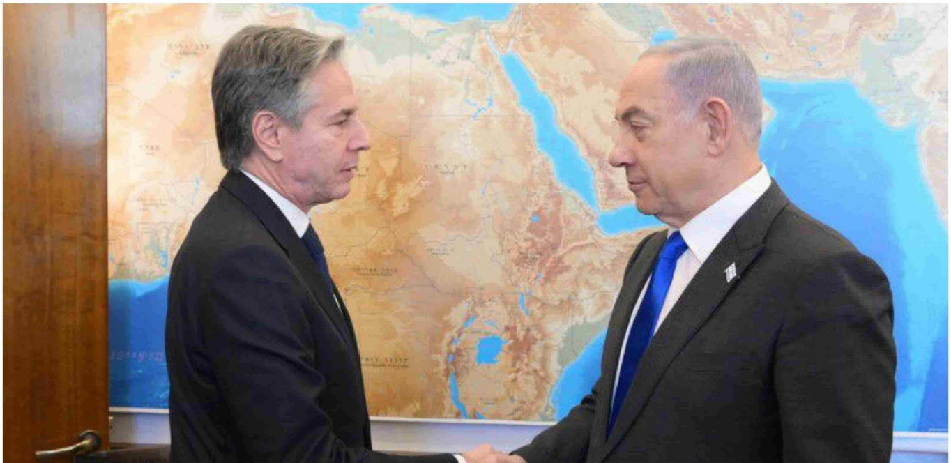
► El primer ministro de Israel, Benjamin Netanyahu, recibe al secretario de Estado norteamericano, Antony Blinken, el 7 de febrero de 2024.