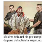
Máximo tribunal día por campal da pena del activista argentino.