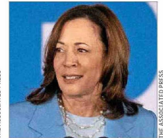
KAMALA HARRIS, vicepresidenta.