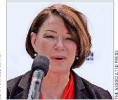
AMY KLOBUCHAR, senadora.