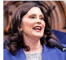
GRETCHEN WHITMER, gobernadora de Michigan.