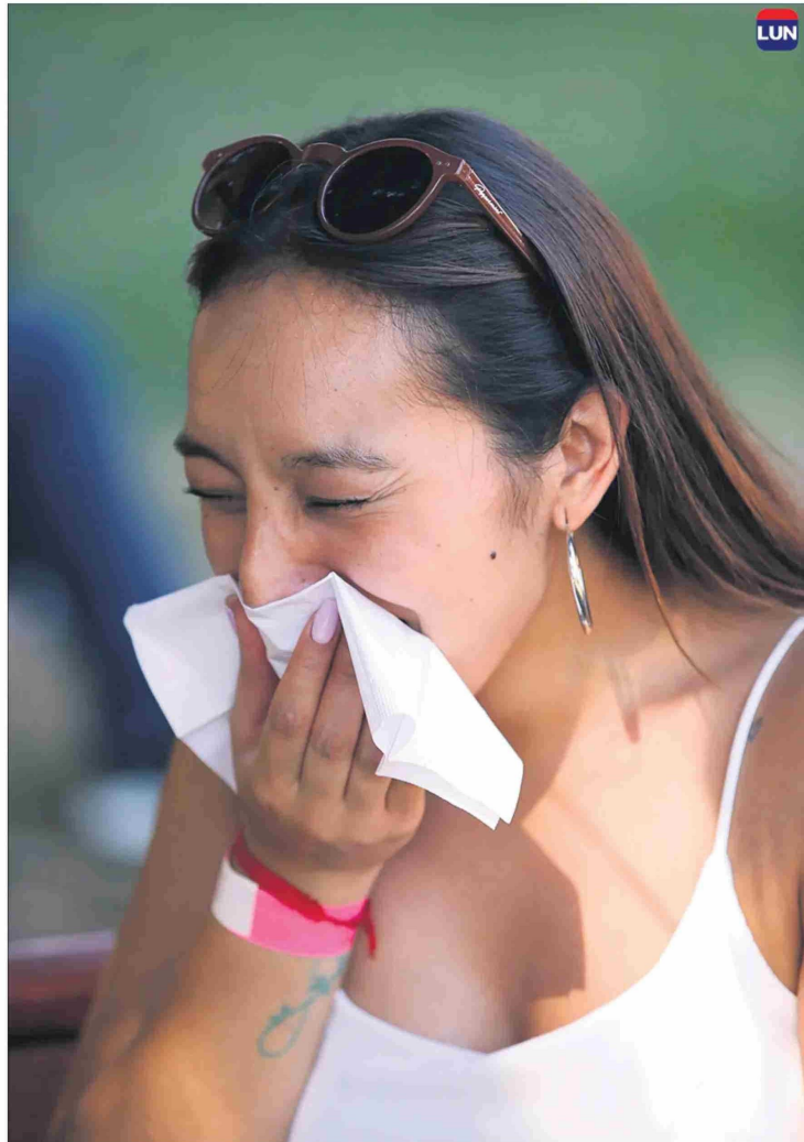
Hasta el 15 de marzo había 6.054 casos de virus respiratorios estacionales.

"Sí, a los grupos de riesgo que son los enfermos crónicos y las personas mayores de 65 años. Tenemos un problema con las vacunas porque no hay suficientes.