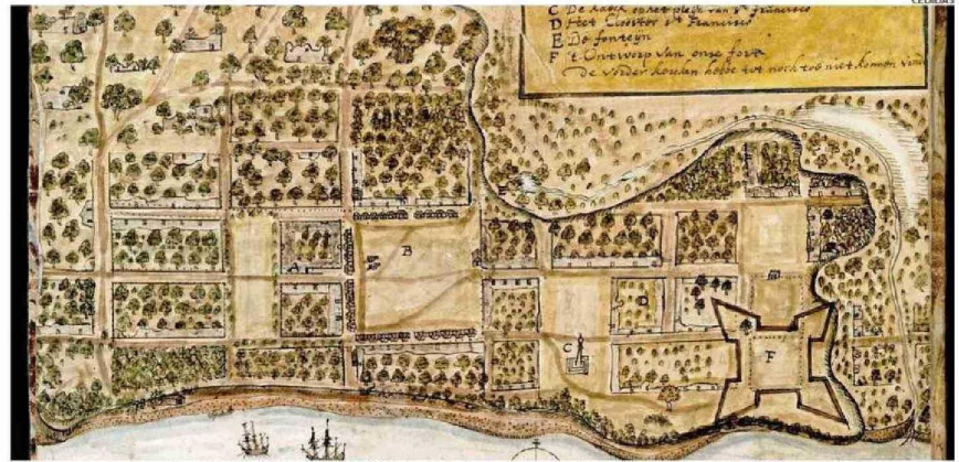
En la imagen, la ribera del actual río Callecalde de Valdivia, retratada por los holandeses como insumo estratégico para el ataque.

“Nuestra expectativa es dar paso a preguntas sobre nuestro pasado. ¿Qué hubiese pasado si los holandeses y