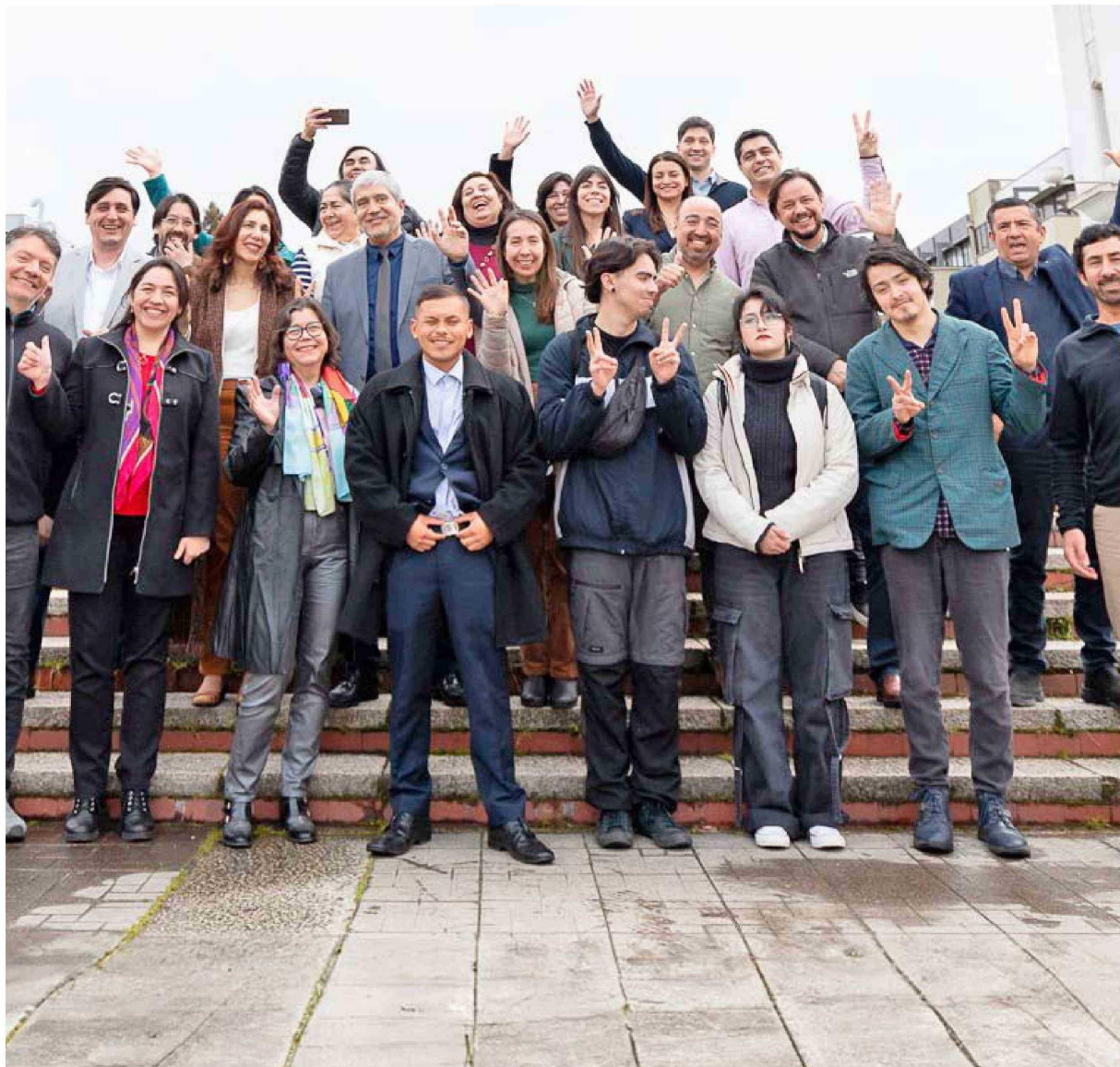
En este hito de lanzamiento participaron autoridades universitarias, IncubaUdeC e integrantes del Consejo Ampliado del Programa Cuidemos Nuestros Campus.