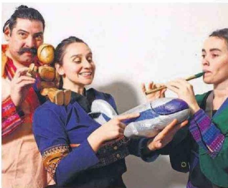
LA CITA CON "ESTUARIO" SERÁ HOY EN EL PARQUE CROACIA.

Antofagasta y Tocopilla recibirán hoy y mañana, respectivamente, obras que serán parte de la amplia cartelera que ofrecerá el tradicional evento hasta el viernes 31.