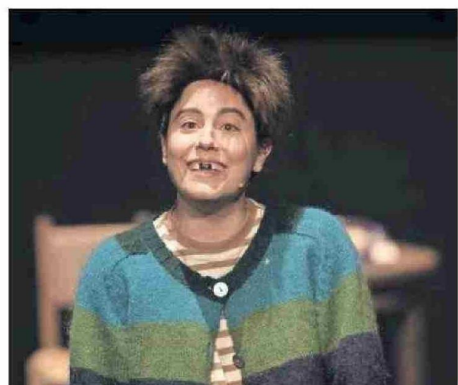
Clásico de las letras nacionales, el personaje de Papelucho iniciará el ciclo de cuatro obras en el Teatro UdeC.