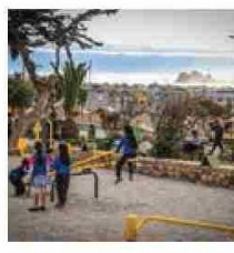
40 nuevas plazas se construyeron en la provincia a través de un proceso participativo donde los vecinos fueron protagonistas.