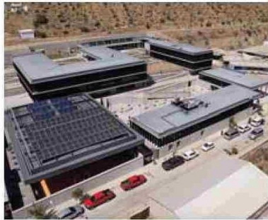
La recién inaugurada Escuela de Canela Alta cuenta con un diseño moderno y funcional para recibir a más de 400 alumnos.

En esa línea y tras el inicio del nuevo ciclo de gestión municipal 2024-2028, la compañía ha manifestado su voluntad de seguir trabajando de manera conjunta para mejorar la calidad de vida de sus vecinos y vecinas, manteniendo el foco provincial y la colaboración público-privada.