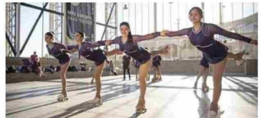
La infraestructura deportiva ha sido uno de los ejes del programa, destacando los estadios y centros comunitarios como El Polígono de Illapel.