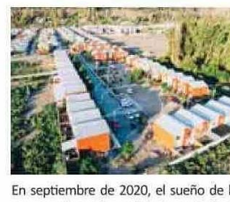
En septiembre de 2020, el sueño de la casa propia se hizo realidad para 50 familias de Salamanca. El proyecto contó con el diseño de la oficina de arquitectos Elemental, en el marco de Somos Choapa.

“Fue un proceso de más de 15 años, una lucha larga y compleja, donde hubo momentos de altos y bajos, pero al final logramos concretar este proyecto. En este proceso hay varios actores involucrados, que si no hubiésemos trabajado en conjunto no se habría podido concretar este sueño”.