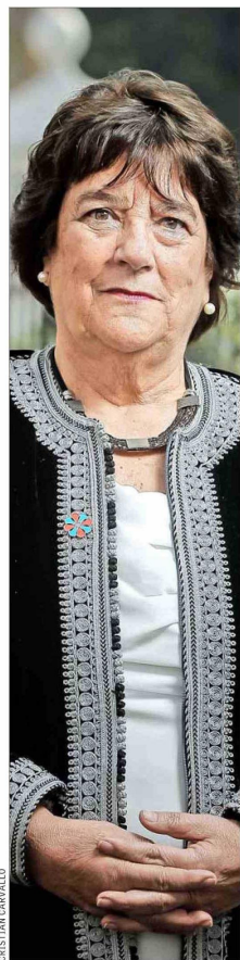
Adriana Delpiano, titular de Educación entre 2015 y 2018.

“Hay bastante evidencia que muestra un sesgo que aún persiste en la formación de las matemáticas entre hombres y mujeres, que aún afecta a muchas veces a las alumnas, y eso hace que estas brechas se sigan manifestando. Creo que es importante seguir trabajando en políticas que permitan identificar la existencia de esos sesgos y que se tomen las medidas para ir revertiéndolas (...). En la medida que pongamos el foco de la política pública donde debe estar, esto es, en los aprendizajes, en la sala de clases, en las posibilidades de cada establecimiento de poder desarrollar con autonomía sus proyectos, los resultados van a tender a la mejora”.