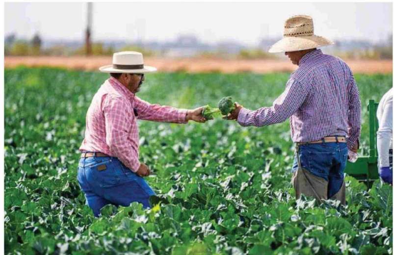
EN PERÚ, se han llevado a cabo grandes proyectos de riego, asegurando su competitividad en relación a Chile, que se ha ido quedando atrás en esta materia, entre otras.

Gana comparó la situación de Chile con Perú, donde, frente a la sequía, se realizaron inversiones como el traslado de agua del Amazonas hacia valles agrícolas sin enfrentar conflictos significativos. "No hubo plebiscitos ni bloqueos, como ocurre en Chile con proyectos similares. Aquí, la oposición de algunos sectores puede paralizar iniciativas estratégicas por años, afectando no solo a la agricultura, sino también a la minería y la energía", enfatizó.