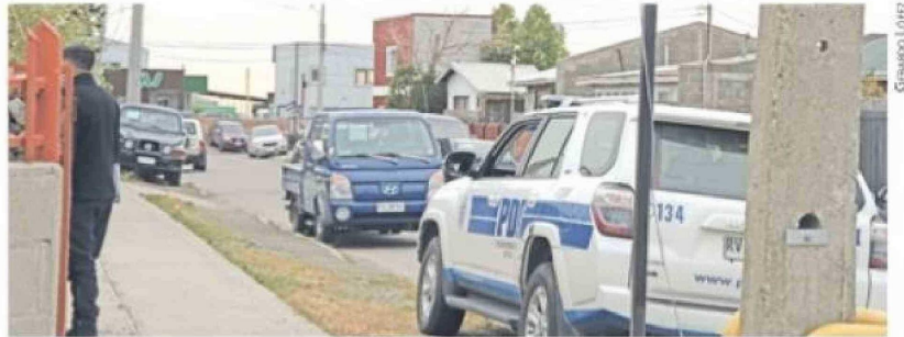
En el sector donde se produjo en la madrugada de ayer el baleo, detectives recogieron evidencia.

El 20 de agosto de 2024 fue formalizado por “femicidio no intimo frustrado”. Y aunque la Fiscalía pidió la internación provisoria en Río de los Ciervos, el tribunal no dio lugar y optó por el arresto domiciliario total.