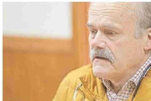
Casi cuatro meses tardaron en responder el oficio del diputado magallánico. El legislador lo solicitó en agosto del año pasado y la respuesta le llegó en diciembre del mismo año.

» Además se informaron de 8 sumarios administrativos en curso en el Hospital Augusto Essmann, en los cuales se investigan eventuales responsabilidades administrativas de funcionarios que corresponden a médicos, por motivos diversos como atenciones, prestaciones o acoso laboral