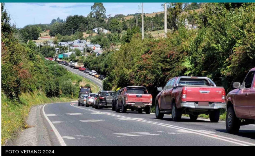
FOTO VERANO 2024.